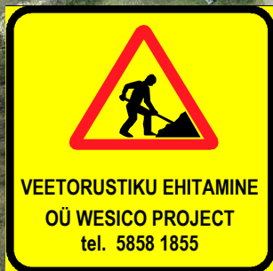
LM 595c, 900 x 900 mm